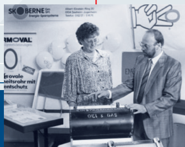
Der Beginn: Das „Energiesparaggregat“ zur Wärmerückgewinnung wird vorgestellt.